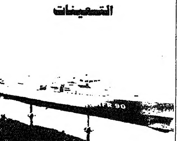
يقوم مجلس مهندسين من دول حلف الناتو الثماني حالياً بوضع تصميم الفرقاطة NFR 90 التي ستكون جاذبة لقوات الحلف في نهاية التسمينات وتعتبر هذه الفرقاطة من امير مشاريع التسليح لدى الحلف. ويبلغ طولها ١٣٥ متراً وتصل سرعتها الى ٣٥ عقدة بحرية. وستحمل كلفنيا اى ٢١٠ ملايين دولار هامبورغ - ا ف ب